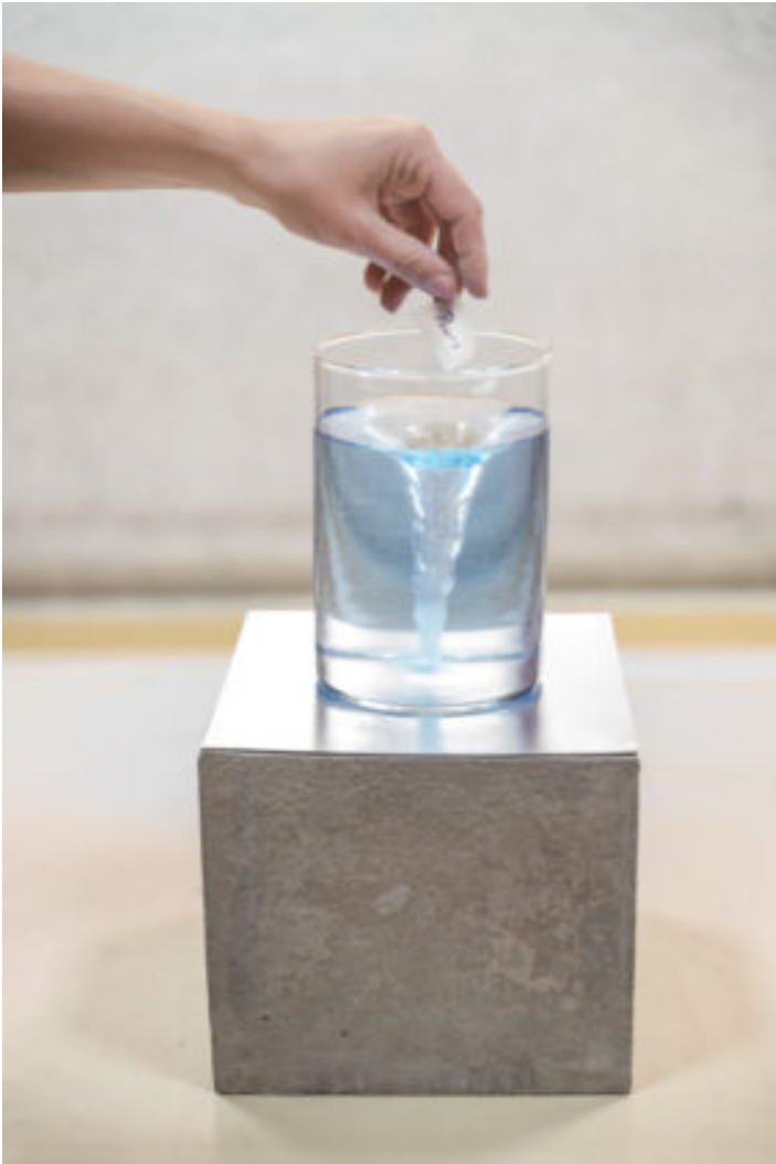
Vortex Ã© Fabrice Leroux

Il a un cÃ´tÃ© lutte pour un retour Ã lâ??Ã©merveillement chez Fabrice Leroux. Â» CÃ©est une rÃ©sonance que lâ??on peut trouver dans mes travaux. Si on pouvait tous obtenir quelque chose, jâ??aimerais que ce soit de rester Ã©merveillÃ© de la vie, de la moindre chose, dâ??un coucher de soleil. Notre capacitÃ© dâ??Ãªtre Ã©merveillÃ© sâ??amenuise aujourdâ??hui car on est trop sollicitÃ©. Je ne dis pas, non plus, que cÃ©tait mieux avant. Â»