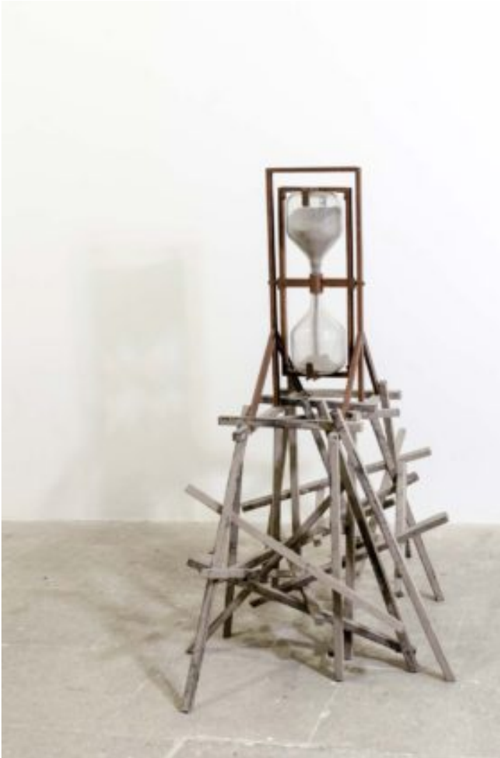
Installation Temps variable © Fabrice Leroux

Le mot, qui revient souvent lorsque vous discutez avec Fabrice, est le temps. Sa création Too much/Not enough visible au macparis présente deux horloges dont les trotteuses font du surplace car l'une a un voltage peu élevé et l'autre trop. Ces deux horloges laissent ainsi le visiteur en contemplation sur ces deux aiguilles qui ne bougent pas de leur place, questionnant ainsi notre propre rapport à la temporalité. « Le rapport au temps est très sensible par rapport à mes heures. Il détermine notre regard à l'instant. Pourquoi est-ce fascinant ? Je pense que tout vient d'un accident, du grain de sable avec lequel tout déraile : ici c'est le fait que les trotteuses soient immuables. Ce n'est pas normal. » Le visiteur se trouve ainsi au centre de l'installation entre le pas assez et le trop, entre ce qui empêche et ce qui use et prend ainsi le temps de se regarder entre ces deux horloges.